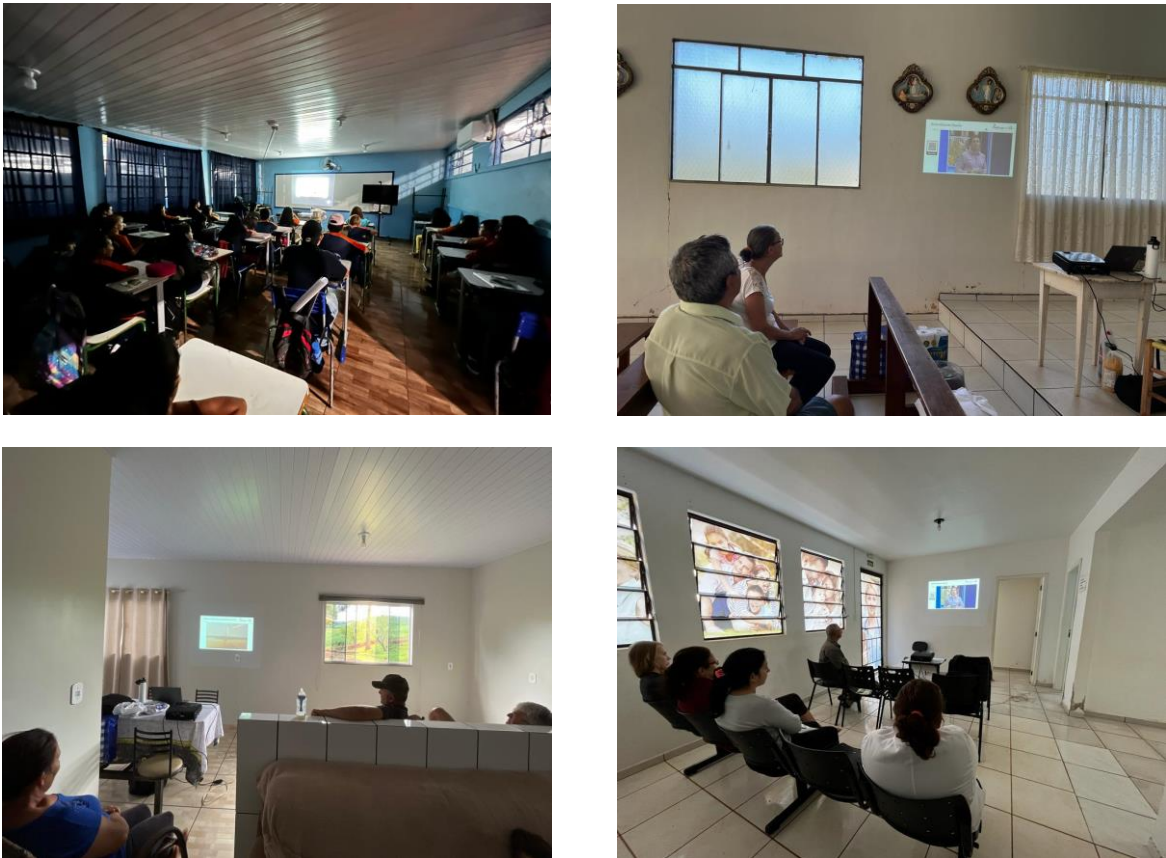
Figura 3 - Registro fotográfico durante a 6ª Campanha do PEA Fase III

Entre os dias 14 e 16 de junho de 2023, ocorreu a 7ª Campanha do Programa de Educação Ambiental (PEA) da Usina Hidrelétrica Baixo Iguaçu. Na ocasião, foram visitadas cinco escolas pertencentes à área de influência da UHEBI. A atividade do PEA envolveu a apresentação de uma palestra aos alunos do 5º ano das escolas previamente selecionadas pela Secretaria de Educação dos municípios de Capanema, Capitão Leônidas Marques, Planalto, Realeza e Nova Prata do Iguaçu. A palestra teve como tema “Resíduos Sólidos”, em vista da proximidade da celebração do Dia Mundial do Meio Ambiente, reconhecido internacionalmente no dia 05 de junho.