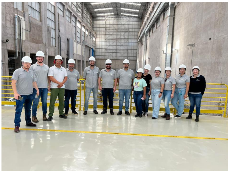
Figura 5 - Registro fotográfico do Programa de Visitação da UHE Baixo Iguaçu