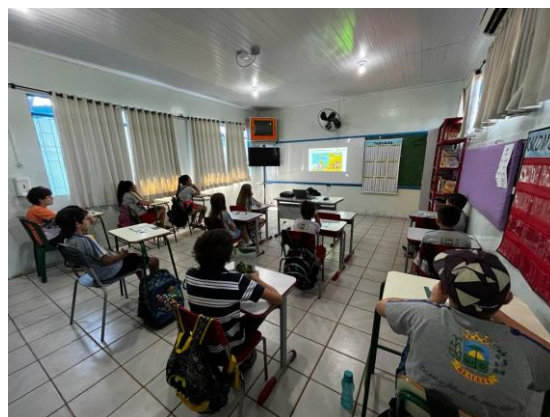
Figura 2 – Registro fotográfico durante a Palestra nas escolas municipais

Entre os dias 17 e 19 de abril de 2023, ocorreu a 6ª Campanha do Programa de Educação Ambiental (PEA) da Usina Hidrelétrica Baixo Iguaçu, junto as comunidades de Marechal Lott (Capanema) e Marmelândia (Realeza), o Reassentamento Rural Coletivo (RRC) de Santa Tereza do Oeste, e a Escola de Santa Maria, também em Santa Tereza do Oeste. A visita na Escola Santa Maria faz parte da mudança no escopo de atendimento de público do PEA que, conforme acordado anteriormente, deixa de atender o Reassentamento de Realeza por falta de público, para direcionar a contribuição do PEA à Escola de Santa Maria, que atende os filhos de reassentados em Santa Tereza do Oeste.