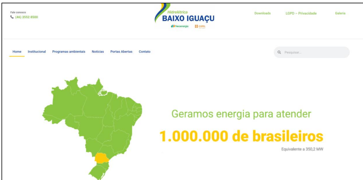
Figura 8 - Imagem do site da UHE Baixo Iguaçu atualizado.

O site da UHE Baixo Iguaçu ( www.baixoiguacu.com.br ) está em constante atualização, sendo inseridos os documentos referentes ao processo de licenciamento que estão disponíveis para download do público conforme previsto no Plano Básico Ambiental. Além disso, documentos legais, releases e fotos do empreendimento.