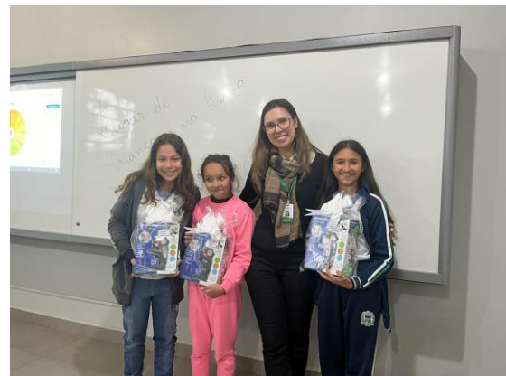
Figura 4 - Registro fotográfico durante a 7ª Campanha do PEA com as Escolas Fase III