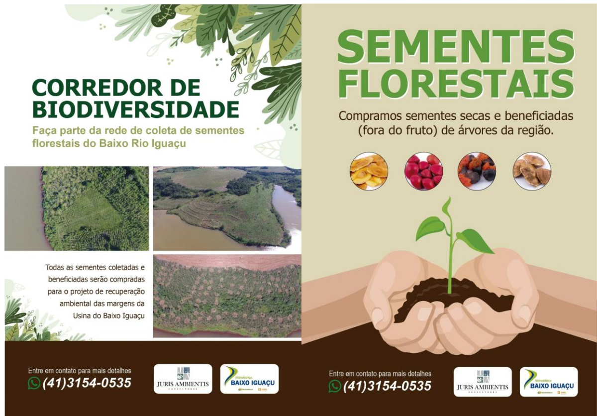
Figura 6 - Folder institucional

Hidrelétrica Baixo Iguaçu, este material é apresentado na Figura 6 . Este material está sendo distribuído durante as ações que a UHE Baixo Iguaçu executa e está disponível para download no site www.baixoiguacu.com.br .