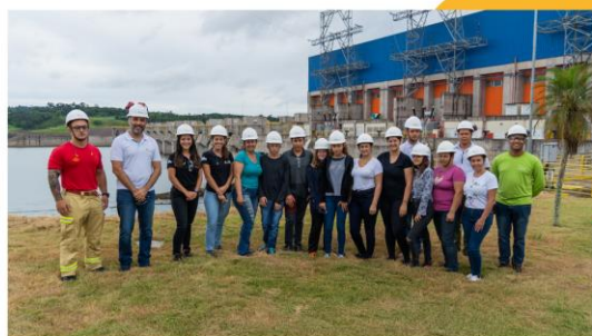
Foto: Visita da Escola Estadual do Campo Castelo Branco - Capanema (PR)

Por fim, foi realizada uma atividade dinâmica de “Mitos x Verdades” com o intuito de refutar falsas notícias que ocorrem pelas comunidades e esclarecer dúvidas dos participantes.